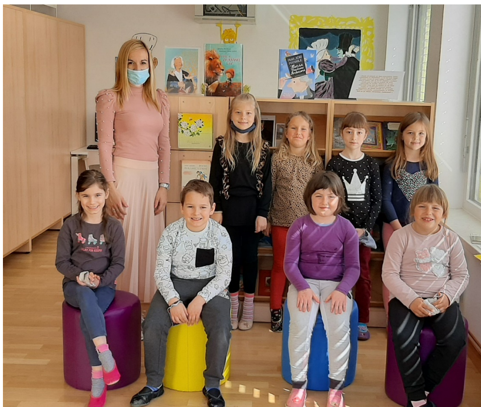
UČENCI 1. RAZREDA V ŠOLSKI KNJIŽNICI

Tudi učenci 1. in 3. razreda so mesec knjige obeležili z učno uro v šolski knjižnici. Podrobneje so spoznali Hansa Christiana Andersena in njegovo življenje ter prisluhnili pravljici.