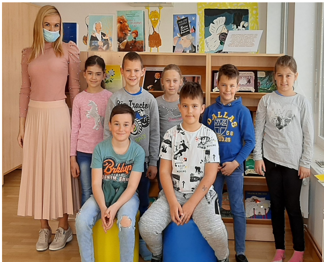
UČENCI 3. RAZREDA V ŠOLSKI KNJIŽNICI