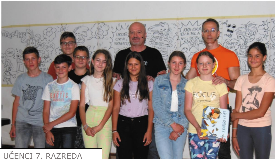
UČENCI 7. RAZREDA