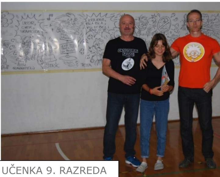
UČENKA 9. RAZREDA