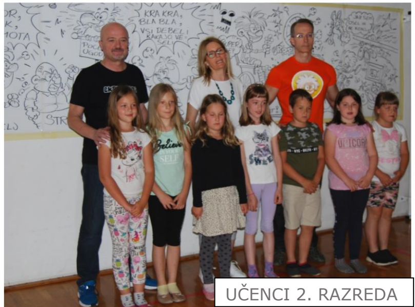
UČENCI 2. RAZREDA