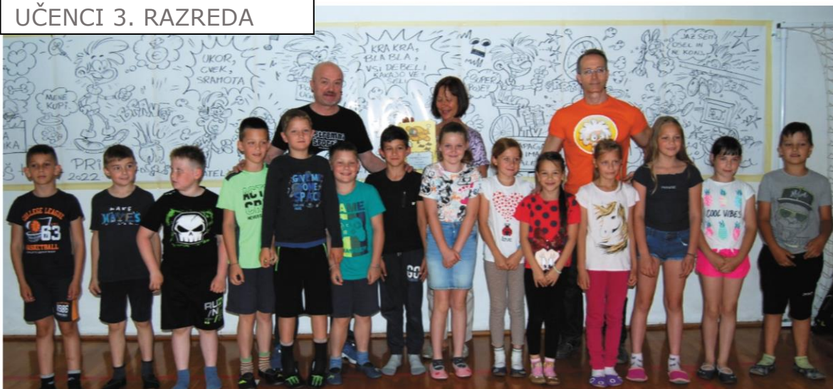
UČENCI 3. RAZREDA