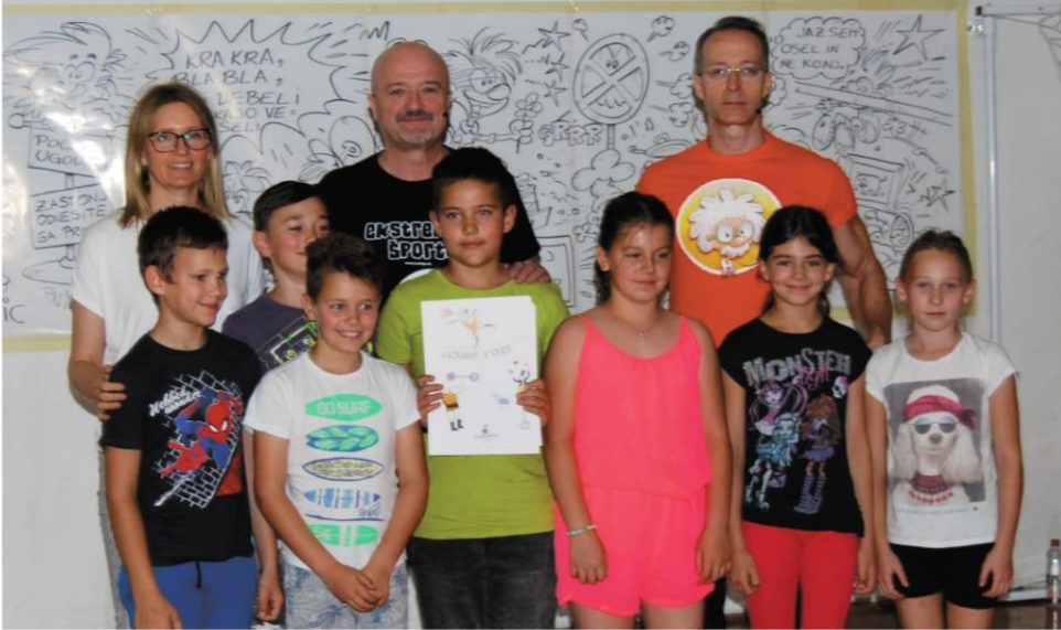
UČENCI 4. RAZREDA