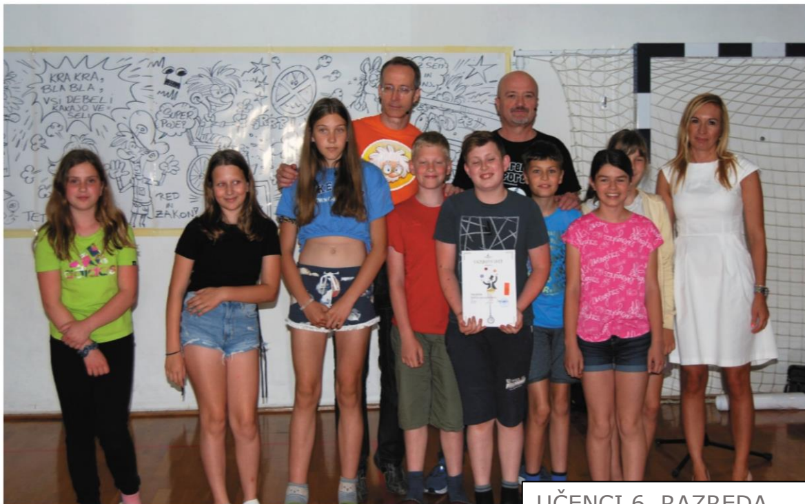
UČENCI 6. RAZREDA