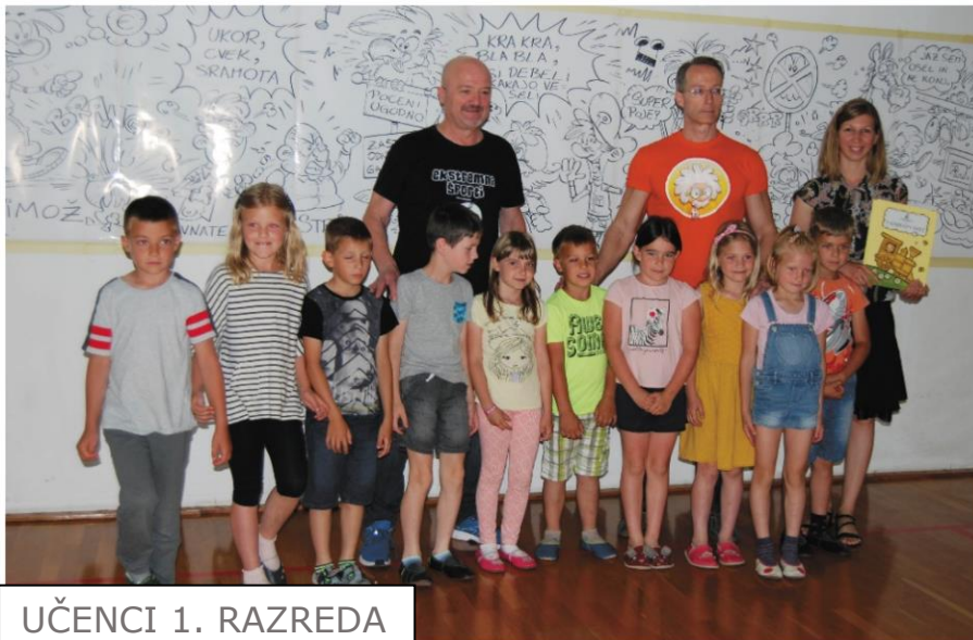
UČENCI 1. RAZREDA