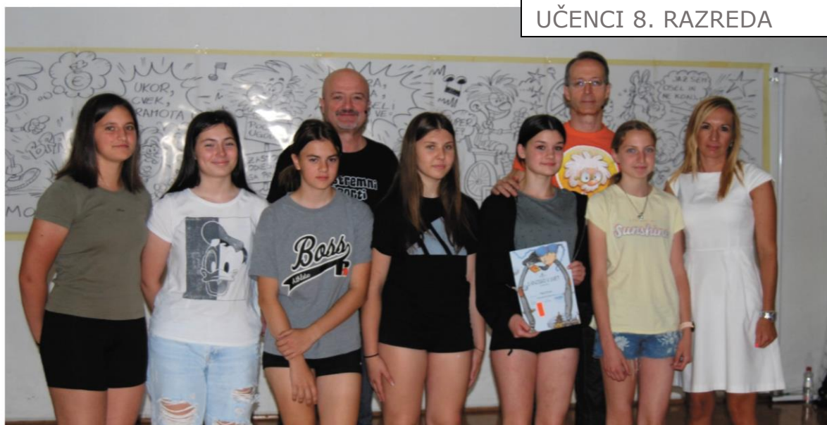
UČENCI 8. RAZREDA